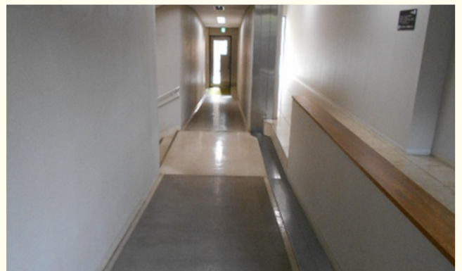
本館⇔1号館の連絡通路